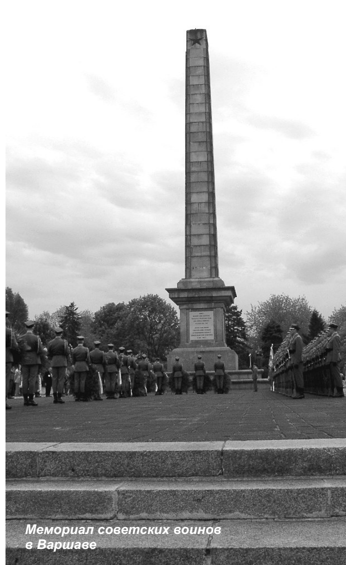
Мемориал советских воинов в Варшаве